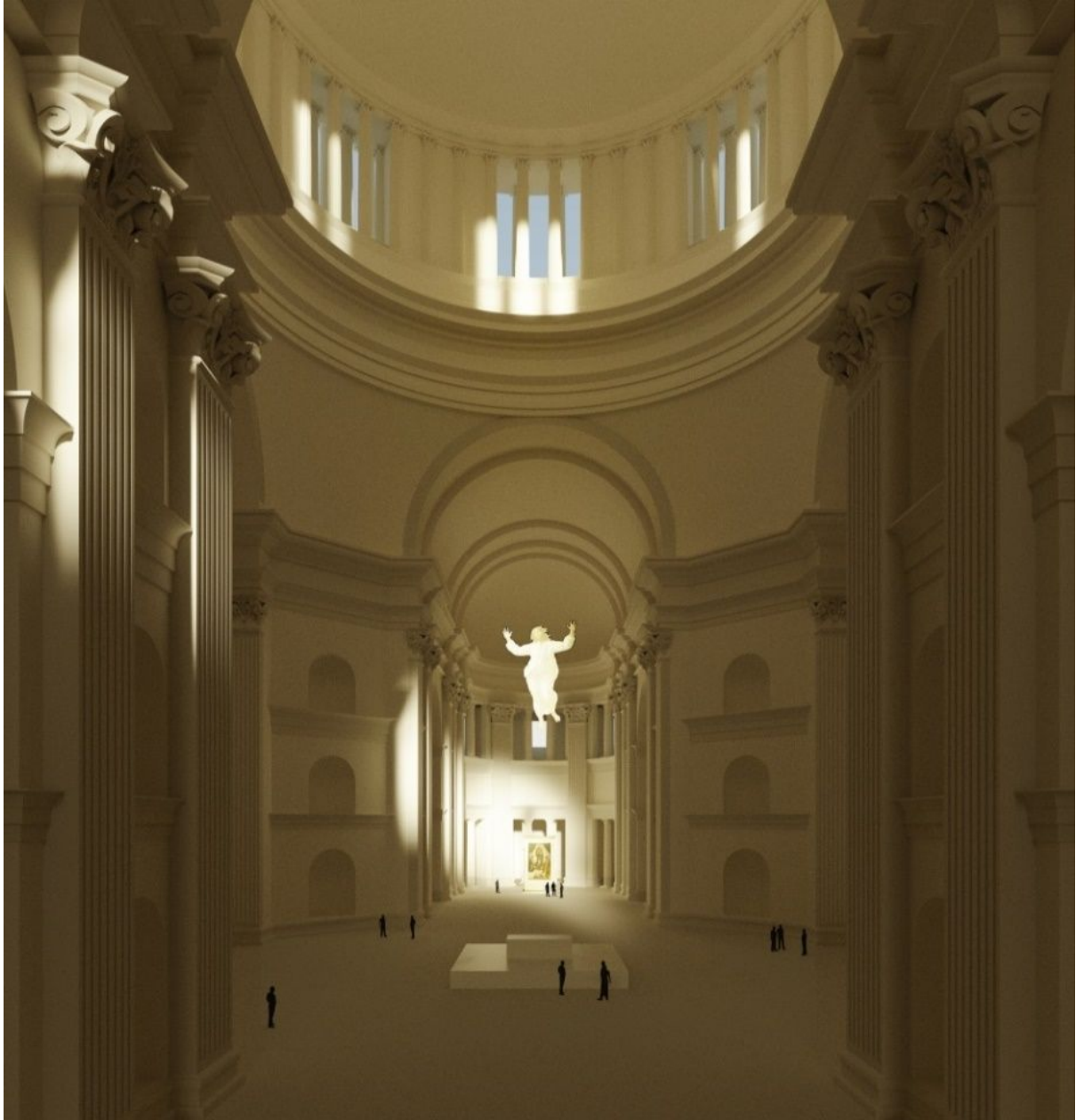
Blick in die Vierung mit dem Altar, der Kuppel darüber und dem Chor